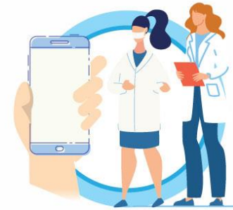
В СЛУЧАЕ ЗАБОЛЕВАНИЯ ОБРАЩАЙТЕСЬ К ВРАЧУ