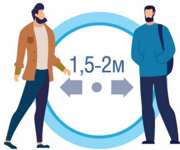
СОБЛЮДАЙТЕ РАССТОЯНИЕ И ЭТИКЕТ